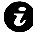
Informations- und Sicherheitshinweise