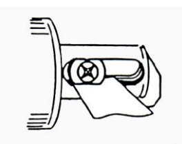
Blatt für Abstand benutzen

Führung (2) fehlt – ersetzen. Beachten Sie, dass die Schraube (3) mit kräftigem Loctite (Nr. 270) befestigt werden muss, da diese sich sonst beim Arbeiten lockert. Achten Sie darauf, dass die Führung vorne nicht klemmt. Benutzen Sie ein dünnes Blech oder Blatt (0,1mm) zwischen der Führung und dem Boden der Rille vorne, wenn Sie die letzte Drehung der Schraube (3) machen.