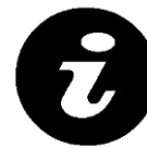
Informations- und Sicherheitshinweise