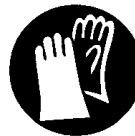
Geeignete Arbeitskleidung tragen