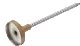
Nadel | Needle