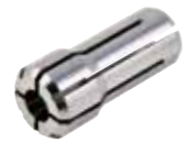
Für | For MDSM 3200 MDSM 3300