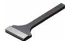
Länge | Length 96 mm