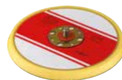
Klett-Teller | Sanding pad