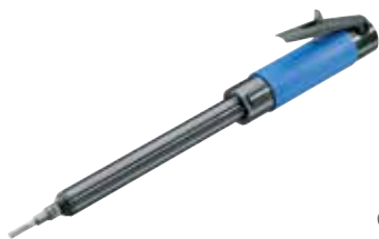
GL 200 H