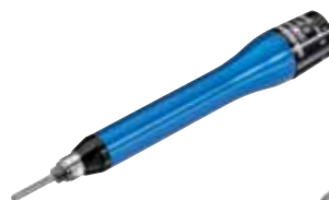
G 551 D