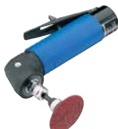
GW 216 H