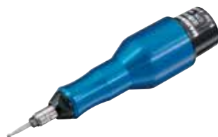
GTK 652 D