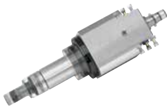
Mit axialer Auslenkung