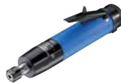
G 16000 H