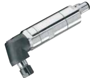
Für den Einbau in Transferstraßen, Werkzeugmaschinen und Roboterstationen