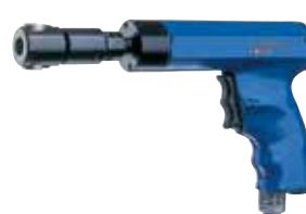
GE 8-500 P