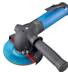
GW 121 H