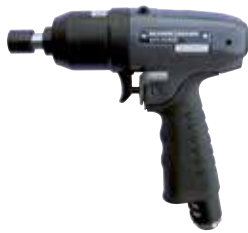
RRI 50 AT