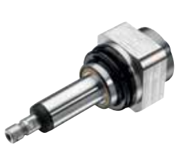
Mit radialer Auslenkung