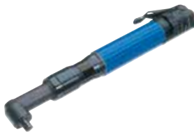
AW 10-352 UA