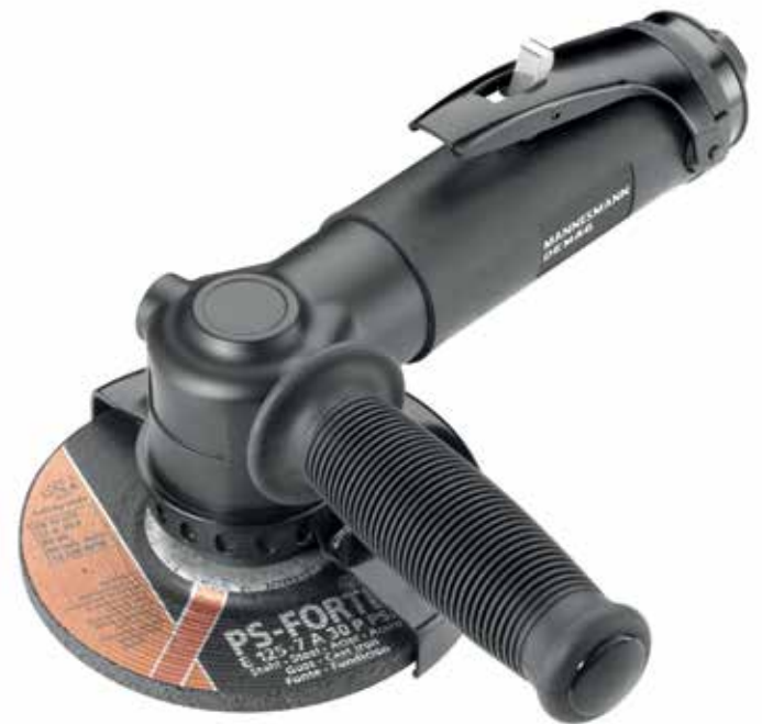
MDWS 4 200