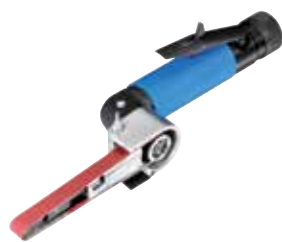
GB 815 H