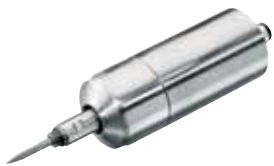
Zum Entgraten, Schleifen und Polieren