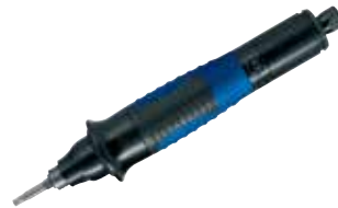
A 4-902 UAS