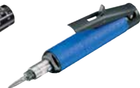
G 352 H