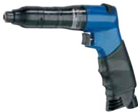
A 5-653 UAPS