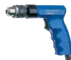
D 6-501 P