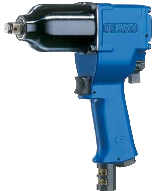
E 16 P3