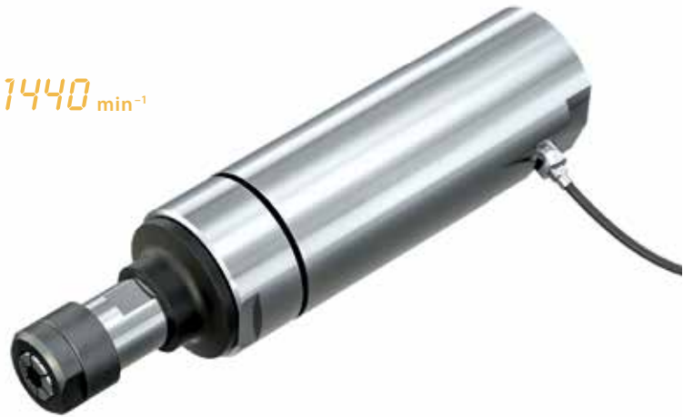
Mit Drehzahlsensor zur Prozessüberwachung