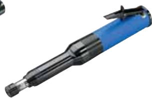
GL 20000 H