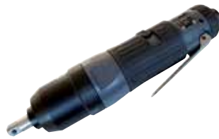
RRI 30 ST