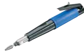
G 201 H