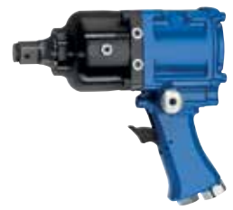
E 36 P2