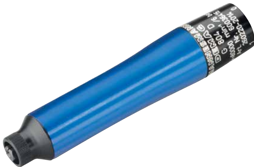
G 804 D

→ Speziell für den Werkzeug- und Formenbau