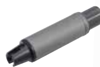
Radial 1-achsige Auslenkeinheit mit Sensoreinheit