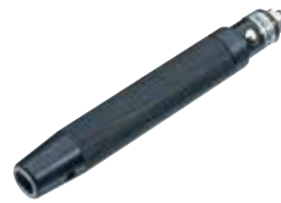
FRV 60 B