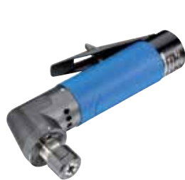
GW 218 HV